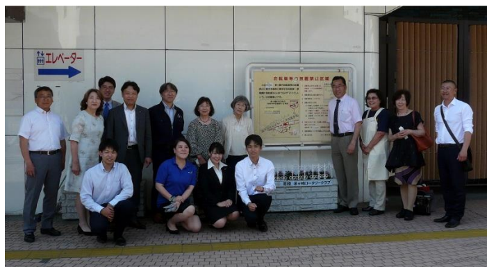
上・右) 例会後、茅ヶ崎駅南口にてペンタスの植栽をしました

各クラブ提出の立法案は、各地区大会または RIBI 地区審議会で審議され地区内各クラブの承認を受けたこと、(時間的余裕がないときは、ガバナー実施の郵便投票)により承認されたことを明記したガバナーの証明書を添付しなければならない